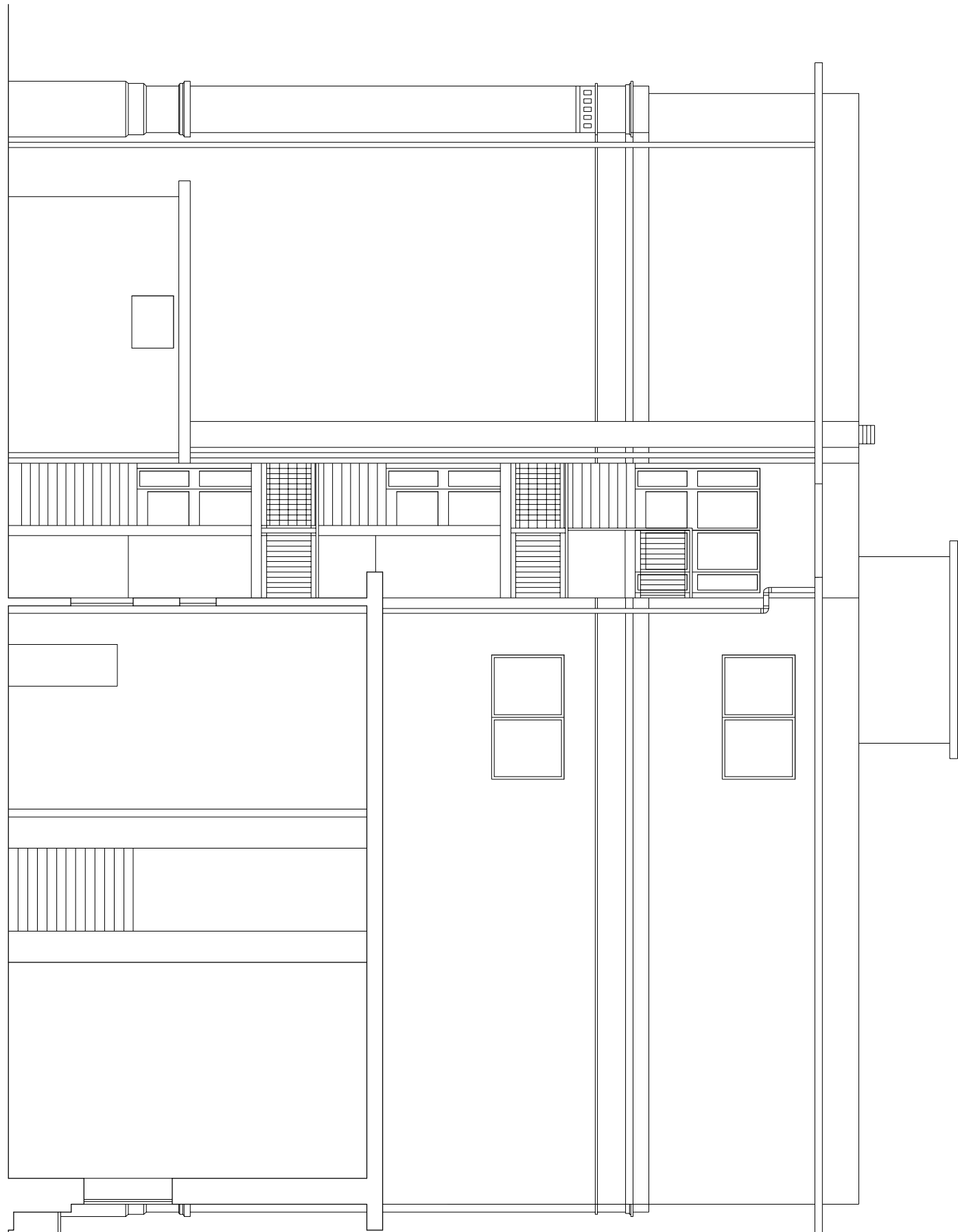
SEZIONE C-C SM